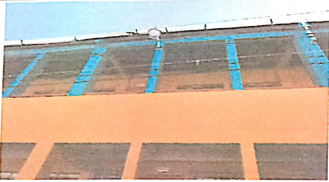
Foto1: Canales y bajas de agua pluvial